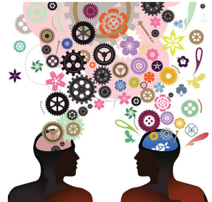
« LE PARTAGE DE SAVOIR »

Partager son savoir, c'est évoluer ensemble et progresser durablement.