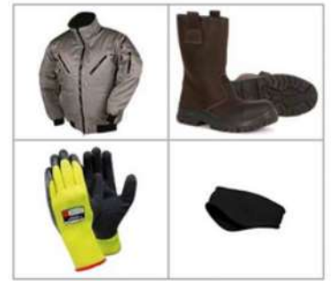
LES EPI D'HIVER

Les EPI (Equipements de Protection Individuelle) d'hiver sont arrivés au magasin. Les EPI d'hiver permettent de se protéger uniquement du froid et ne protègent pas des nombreux risques que l'on peut rencontrer. Il ne faut pas oublier les EPI obligatoires sur le site : bouchons d'oreilles, casquettes coquées (ou casques), chaussures de sécurité et lunettes. Ces EPI sont importants au quotidien pour préserver votre santé et assurer votre sécurité.